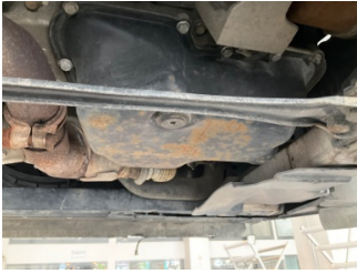
Motor, Yağ karteri > Hasarlı