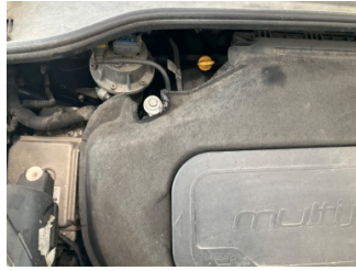
Motor, Motor üst kapağı, plastik > Hasarlı