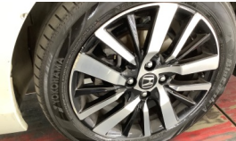
Jant, sol ön > Çizik