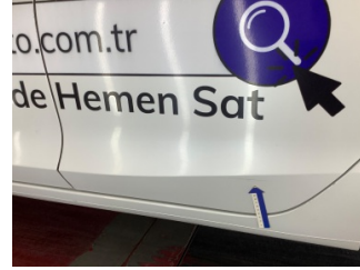
Kapı, sol arka, Kapı, sol arka > Çizik