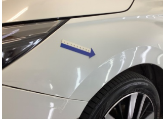
Çamurluk, sol, Çamurluk, sol > Standart Dışı Onarım