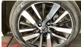
Jant, sağ ön > Çizik