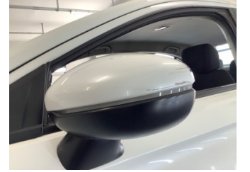
Dikiz aynası, sol, Dış dikiz aynası > Çizik